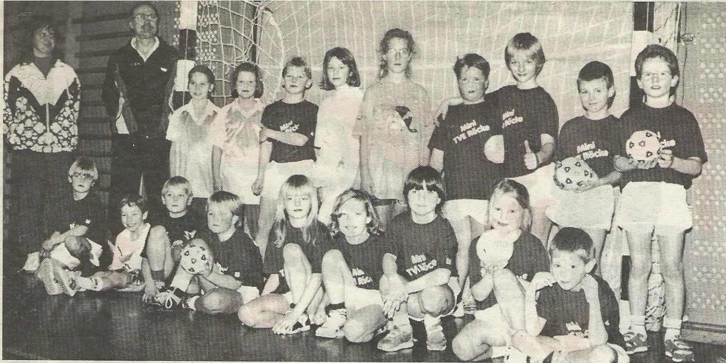
Minis, Trainer und Handball-Leiterin des TVE Rösche auf einen Blick.